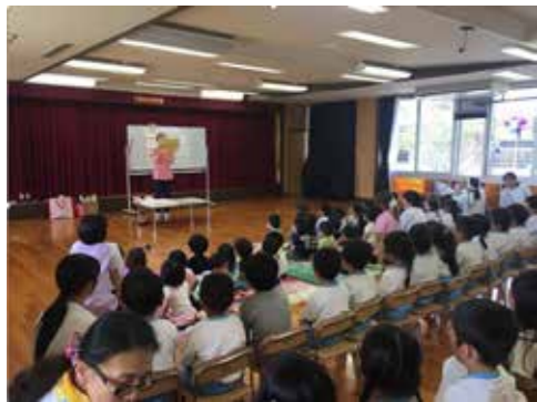
鶴原保育園での紙芝居の様子です。みなさん静かに聞いてくれました(^)/

この6月1日、アップル歯科は1周年を迎えました。この日が迎えられたのも、患者様や地域の皆様のおかげだと感謝しております。