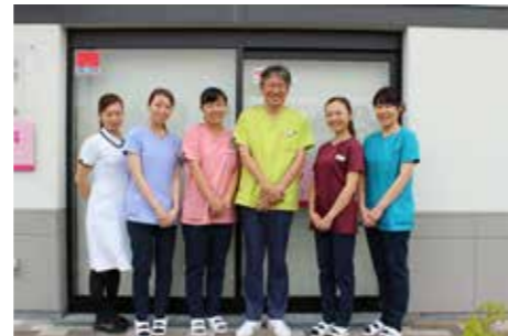
私たちがお伺い致します。

★訪問歯科は保険内診療です。交通費は一切必要ありません。詳細はお問い合わせ下さい。