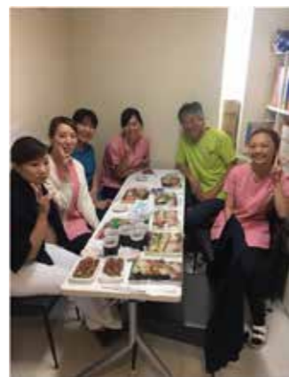
1周年記念パーティーをしました☆