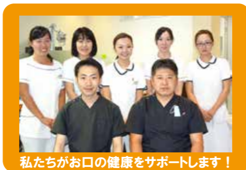
私たちがお口の健康をサポートします！

基本的に保険内診療となりますので、ご安心ください。 ※初診時と毎月初めには保険証などを確認させていただきます。