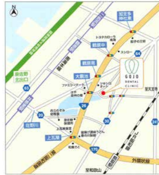
第二阪和国道(国道26号線)「上瓦屋」交差点を北東に650m直進、「大蔵池」交差点を東へすぐ