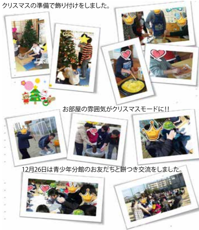
お部屋の雰囲気がクリスマスモードに!!

12月25日にお楽しみ会で料理をつくったよ! クリスマスの準備で飾り付けをしました。