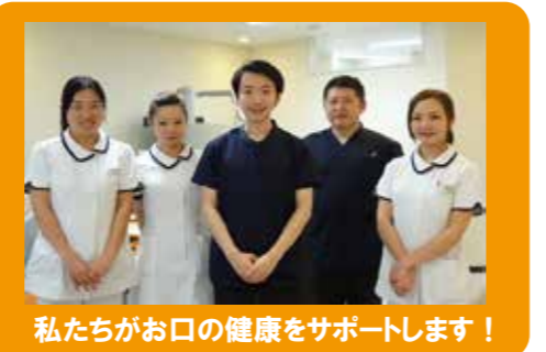
私たちがお口の健康をサポートします！